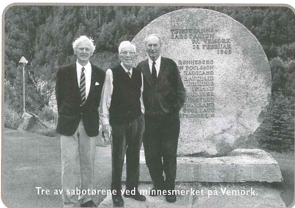
Tre av sabotørene ved minnesmerket på Vemork.