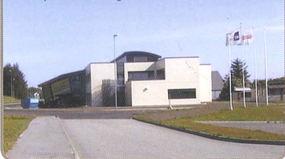
Den nye Hovedredningsentralen.